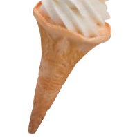
揚げ浜塩バニラ 300円