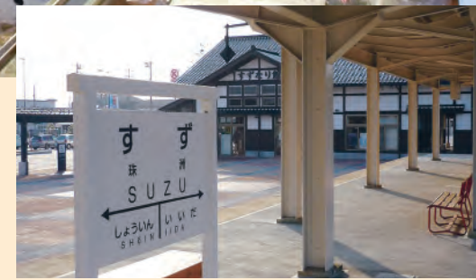
プラットホームと線路の一部を保存して、旧珠洲駅の面影が残っています