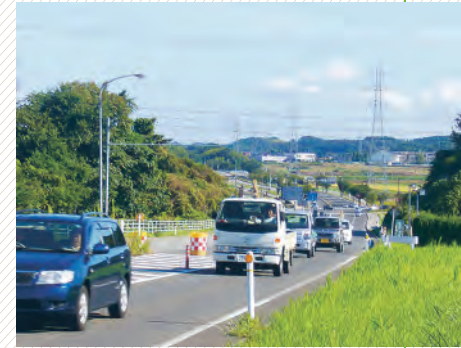
▲加賀産業開発道路の4車線化に着手する小松市軽海町内

料道路では、内灘町大根布〜かほく市白尾間の4車線化に着手し、新幹線開業までの供用を目指すほか、加賀産業開発道路では、小松市軽海町〜八幡間で工事を進め、全線4車線