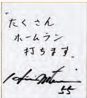
県民の皆さんへのメッセージを色紙に書いていただきました

不調時には、引退の可能性を伝える報道もありました。もちろん、年齢やけがの状態を考えると、成績が下降線をたどれば、引退がさやかれるのも当然です。それでも、自分自身の中で