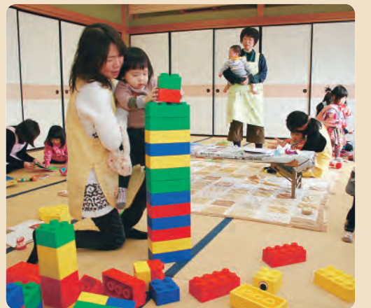
子どもたちの笑顔が広がる託児サポートの様子