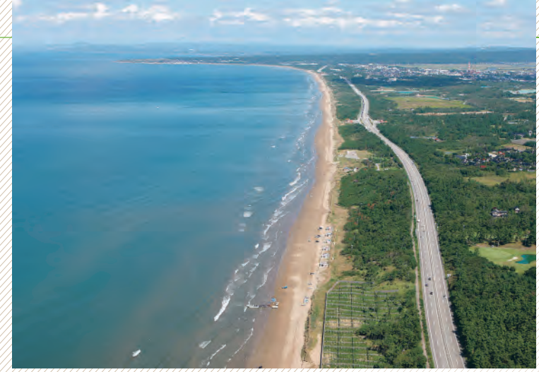
▲平成25年4月の無料化が決まった能登有料道路。写真の千里浜をはじめ、能登各地の観光スポットのにぎわい創出に期待が高まります

県では、3大都市圏との交流拡大や観光周遊性の向上のため、南北に細長い県土に2本のはしご(ラダー)状に道路網を形成する「ダブルラダー」結いの道 整備構想を推進し、珠