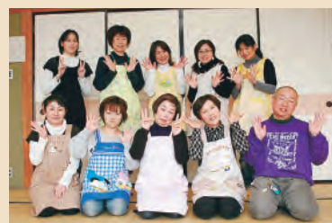
現在、メンバーは約40人。20代~70代まで幅広い世代の方が参加しています

まつい・ひでき 1974年根上町(現能美市)生まれ。星稜高校卒業後、読売ジャイアンツに入団。2003年にメジャーリーグに挑戦。09年にニューヨーク・ヤンキースの中心選手として悲願のワールドチャンピオンに輝くとともに、日本人初のワールドシリーズMVPを獲得。ロサンゼルス・エンゼルスを経て、11年はオークランド・アスレチックスに所属。プロ入り18年間で日米通算2500本安打まで残り1本に迫っている。