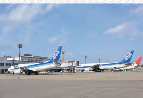
▲今年、開港50周年を迎える小松空港では、さまざまなキャンペーンを実施

※航空券を28日前までに予約・購入の場合、最大69%割引引き。運行ダイヤ・運賃は変更となる場合があります。詳しくは各航空会社にお問い合わせください。