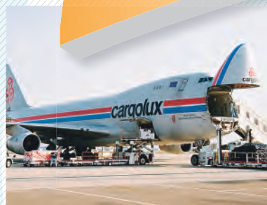
▲カーゴルクス国際貨物便