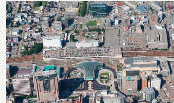
▲金沢駅周辺では民間商業施設の集積が進んでいます