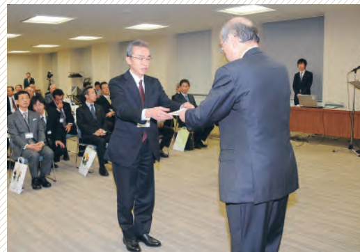
▲「いしかわ観光特使委嘱状交付式」を開催しました

また、口コミによるすそ野の広い観光振興策として、県内企業の支店に勤務する方や首都圏に住む県内出身者らを「いしかわ観光特使」に委嘱。昨年12月までに565人に委嘱し、全国の支店に観光パンフレットを配置したり、顧客向けの石川ツアーを実施したりするなど、特使の方それぞれが特色ある草の根活動を展開しています。 県では、特使の皆さんの活動をサポートし、情報発信力をより強化していくため、平成23年度は県内や3大都市圏で交流会を4回開催する予定です。