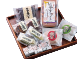
能登大納言スイーツ（パウンドケーキ550円、姫どら140円など）