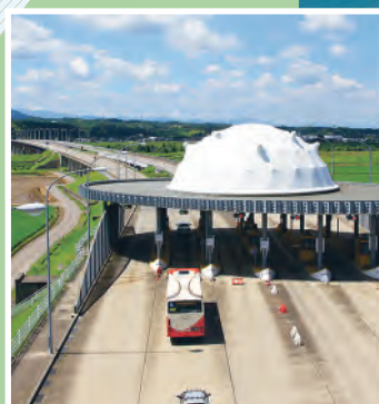
▶川北大橋有料道路

本格的な人口減少社会に突入したと言われる日本。それは平成17年まで日本海側で唯一人口が増加していた石川県も例外ではなく、今後、活力あるふるさとづくりを進める上では、「人」と「もの」の流れを活発にしていけることが欠かせません。これまで全国はもちろん、世界各地との交流を拡大するため、小松・能登の2つの空港や金沢・七尾の2つの港、南北東西に伸びる道路網など、交流基盤の整備を進めた結果、その成果が観光やビジネスなど多方面で表れてきています。そして、交流基盤整備の総仕上げとも言える北陸新幹線の金沢開業まであと3年。県では、陸・海・空の交流基盤を総合的に活用し、石川の飛躍に向け、これまでの取り組みをさらにステップアップさせます。今回の特集では、これらの交流基盤整備と、新幹線開業を見据えて改定した「新はつと石川観光プラン」を紹介します。