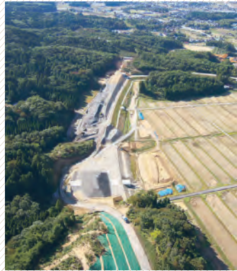
▲着々と整備が進む能越自動車道

でがつながら、北陸自動車道や東海北陸自動車道経由で、全国各地から能登への交通アクセスの利便性が格段に向上します。