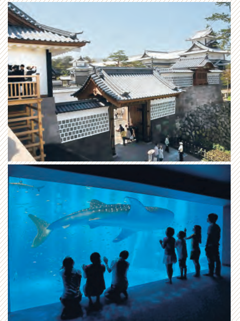
▲各観光地では一層の魅力アップに力を注いでいます。写真は、復元整備が進む金沢公園とジンベエザメ館を開設したのとしま水族館

県では、観光ニーズや社会環境など、プラン策定後のさまざまな変化にきめ細かく対応するとともに、北陸新幹線開業に向けて、より重点的に取り組んでいく課題を整理するため、新ほっと石川観光プランを改定しました。改定にあたっては観光分野の専門家や県内有識者などによる中間評価を実施しました。 そこで示された意見などを参考に改定版では、開業年の平成27年をめどに観光客数や観光消費額などの新たな目標値を設定しています。その一つとして、首都圏500万人構想を追加しました。これは、新幹線開業を機に時間距離がぐっと近づく首都圏からの観光客数を230万人(21年実