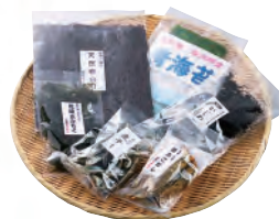
海産物（乾燥あかもく315円、あご煮干し630円など）