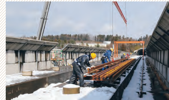
▲県内分のレールを搬入する作業が始まっています