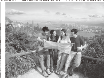
ピーク山頂ハイキング