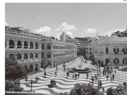
マカオ：セナド広場