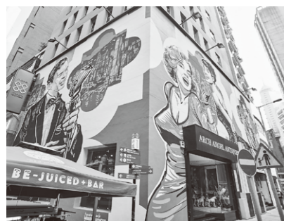
オールド・タウン・セントラル