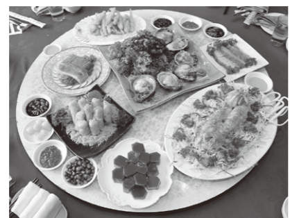
世界の料理が満喫できるグルメパラダイス