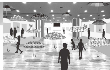
特別企画イメージ