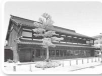
金沢市老舗記念館