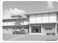
いしかわ生活工芸ミュージアム