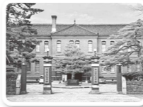
石川四高記念文化交流館