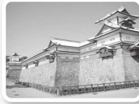
金沢城公園(菱櫓等)