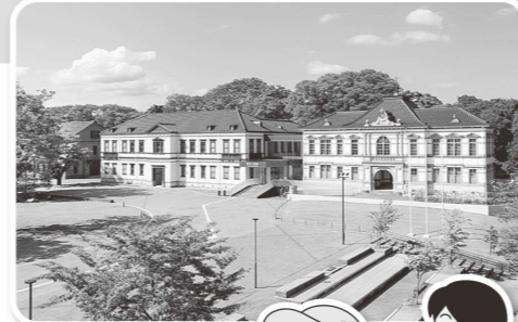
国立工芸館