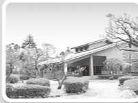
金沢市立中村記念美術館