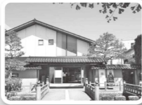
前田土佐守家資料館