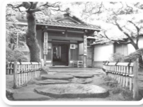
武家屋敷跡 野村家