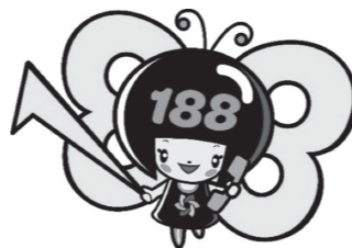
消費者庁 消費者ホットライン188 イメージキャラクター 「イヤヤン」

県消費生活支援センター ☎076 (267) 6110 警察相談専用電話 ☎#9110