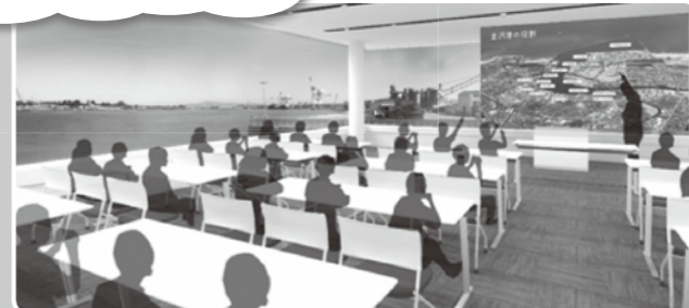
セミナールームでの学習風景イメージ