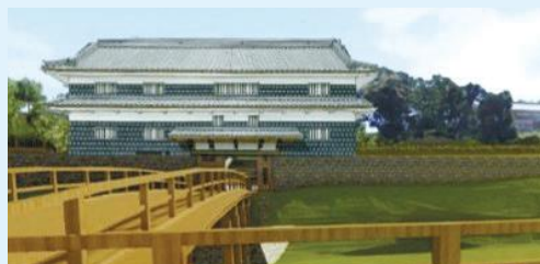
鼠多門・鼠多門橋(イメージ)