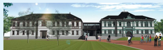
国立工芸館(イメージ)