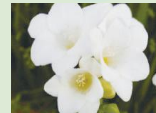
2020年春デビュー予定のエアリーフローラ純白新品種