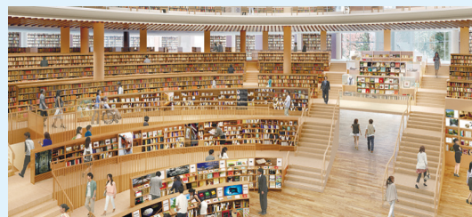
新図書館内部(イメージ)