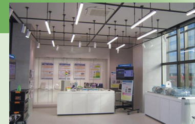
いしかわAI・IoT技術支援工房