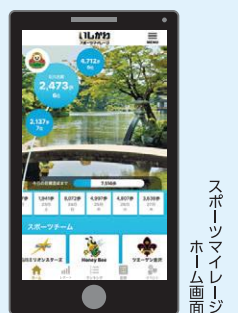
スポーツマイレージホームページ画面