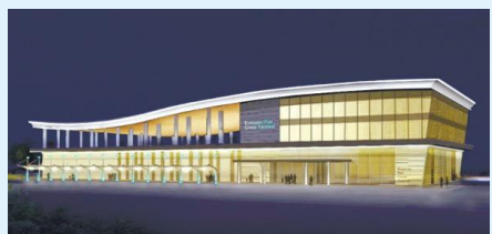
金沢港クルーズターミナルライトアップ(イメージ)