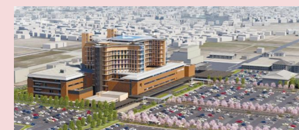
県立中央病院外構整備(イメージ)