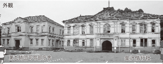
第九師団司令部庁舎