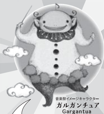
音楽祭イメージキャラクター ガルガンチュア Gargantua