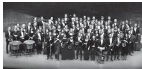
ザルツブルク・モーツァルト管弦楽団

5月5日(土・祝)15:50~16:50 コンサートホール/S席 2,500円 A席 2,000円 出演 リッカルド・ミナーシ(指揮) ヴェンツェル・フォックス(クラリネット) ザルツブルク・モーツァルト管弦楽団