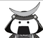
仙台・宮城観光PRキャラクター むすび丸