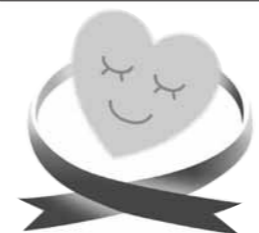
※パープルリボンは女性に対する暴力をなくす運動のシンボルマークです

県では、配偶者やパートナーからの暴力を許さないという意識を社会全体で醸成するため、11月を「いしかわパープルリボンキャンペーン」の期間とし、DV根絶に向けた啓発活動を実施しています。