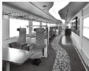
イベントスペースを中心に、にぎやかに旅を楽しめる