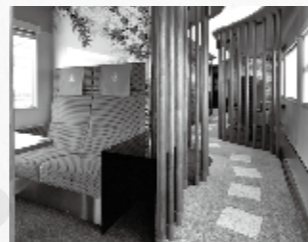
8つの半個室と物販スペースがあり、ゆったりとくつろぎの旅を楽しめる