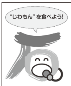
地産地消推進シンボルマーク

県産食材コーナーを設けたり、県産食材の正しい情報を消費者に提供するなど、地産地消に積極的に取り組んでいる県内のスーパーや小売店などを、「地産地消推進協力店」として認定しています。