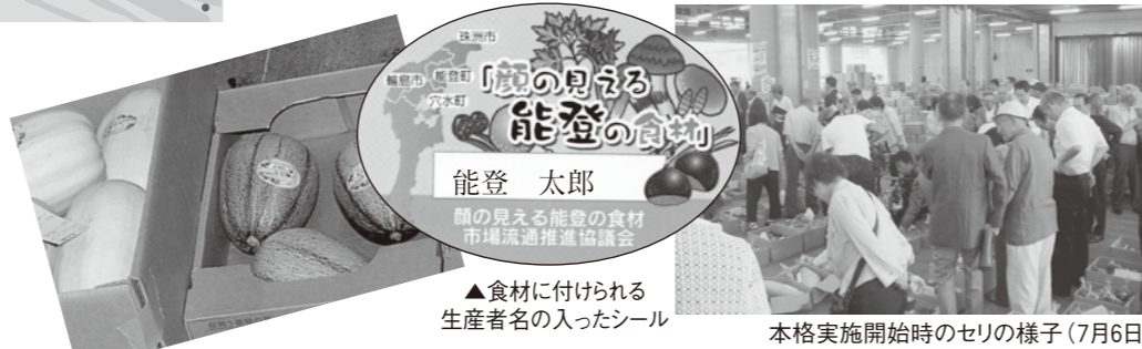
▲食材に付けられる生産者名の入ったシール

量がまとまらないことからこれまで出荷されてこなかった奥能登の魅力ある農産物を、広域的に集荷することで出荷できるようになったもので、地産地消の新たな取り組みとして注目されています。