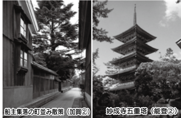
船主集落の町並み散策 (加賀②)