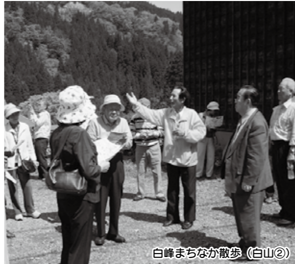
白峰まちなか散歩 (白山②)