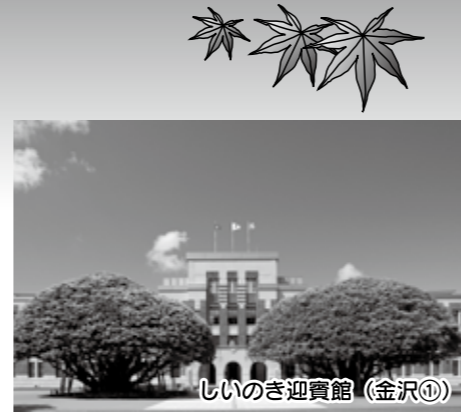
しいのき迎賓館 (金沢①)

まだまだあります! 金沢16コース、能登23コース、白山20コース、加賀8コース 詳しくはこちら www.hot-ishikawa.jp/walk/