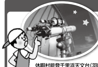
休暇村能登千里浜天文台(羽咋市)

禄剛崎(珠洲市)、満天星(能登町)、七尾城跡(七尾市)、宝達山(宝達志水町)、千里浜海岸(羽咋市)など