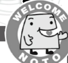
能登ふるさと博マスコットキャラクター「のとドン」

JR七尾線(金沢~七尾)…とうはくん号、わくたまくん号、UFO号 のと鉄道(七尾~穴水)…のとドン号(土日祝日は「のとドン」と観光ガイドが乗車します。)