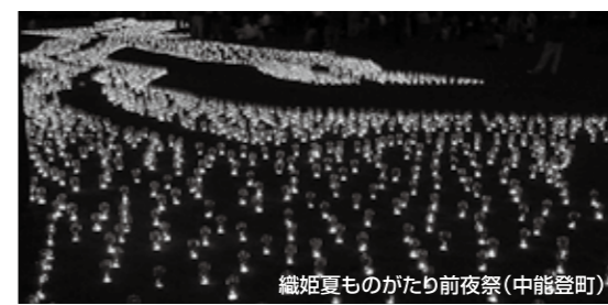
織姫夏ものがたり前夜祭(中能登町)