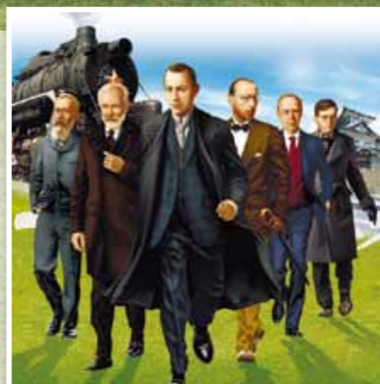
左からリムスキー=コルサコフ、チャイコフスキー、ラフマニノフ、ストラヴィンスキー、プロコフィエフ、ショスタコーヴィチ

しいのき迎賓館 ☎076(261)1111 ◎MUTTONI WORLD 自動人形師ムットー二展 会期/4/28(土)~5/13(日) ◎ラ・フォル・ジュルネ金沢「熱狂の日」音楽祭2012 街なかコンサート 無料 会期/4/28(土)11:00~11:30 ◎しいのきコンサート 無料 会期/4/29(日・祝)14:00~14:45 ◎ラ・フォル・ジュルネ金沢「熱狂の日」音楽祭2012 吹奏楽の日 無料 会期/4/30(月・振休)10:00~16:30 藩老本多蔵品館 ☎076(261)0500 ◎特別展「安房守・政重」 会期/4/27(金)~7/25(水)