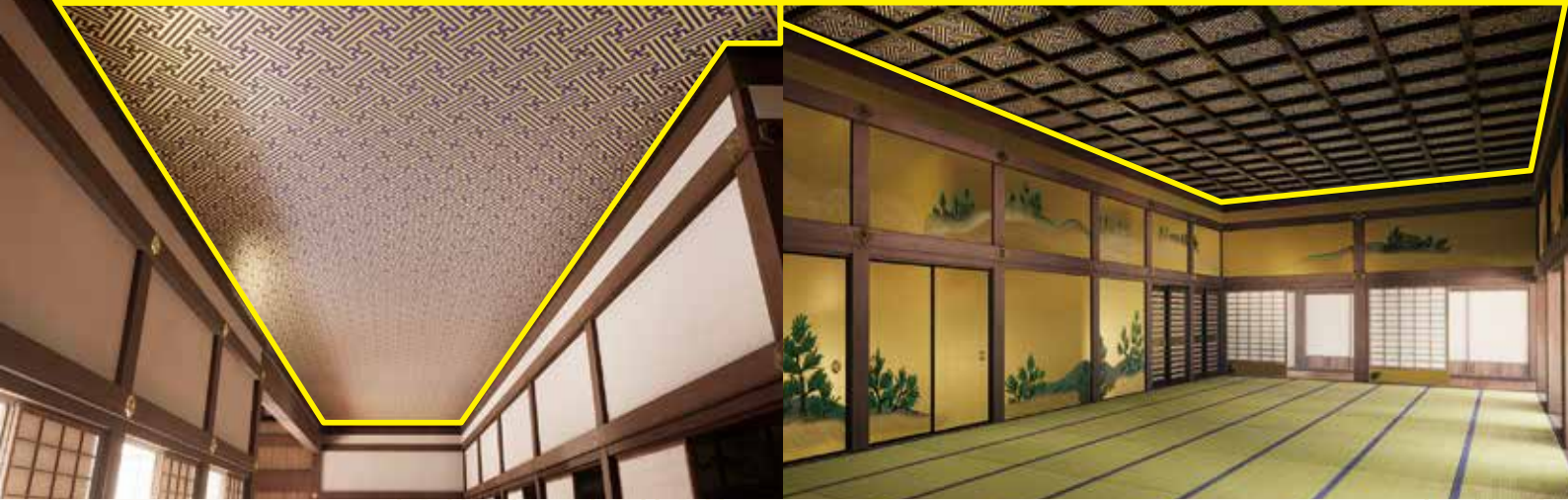
▲二の丸御殿の天井は、石川県産の杉板に模様のある紙を張って仕上げられます。