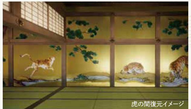
虎の間復元イメージ

石川県では、これまでの金沢城復元の総仕上げとも言える二の丸御殿の復元に着手し、令和8年4月から第1期の御殿本体工事を着工、令和15年度頃の完成を目指しています。