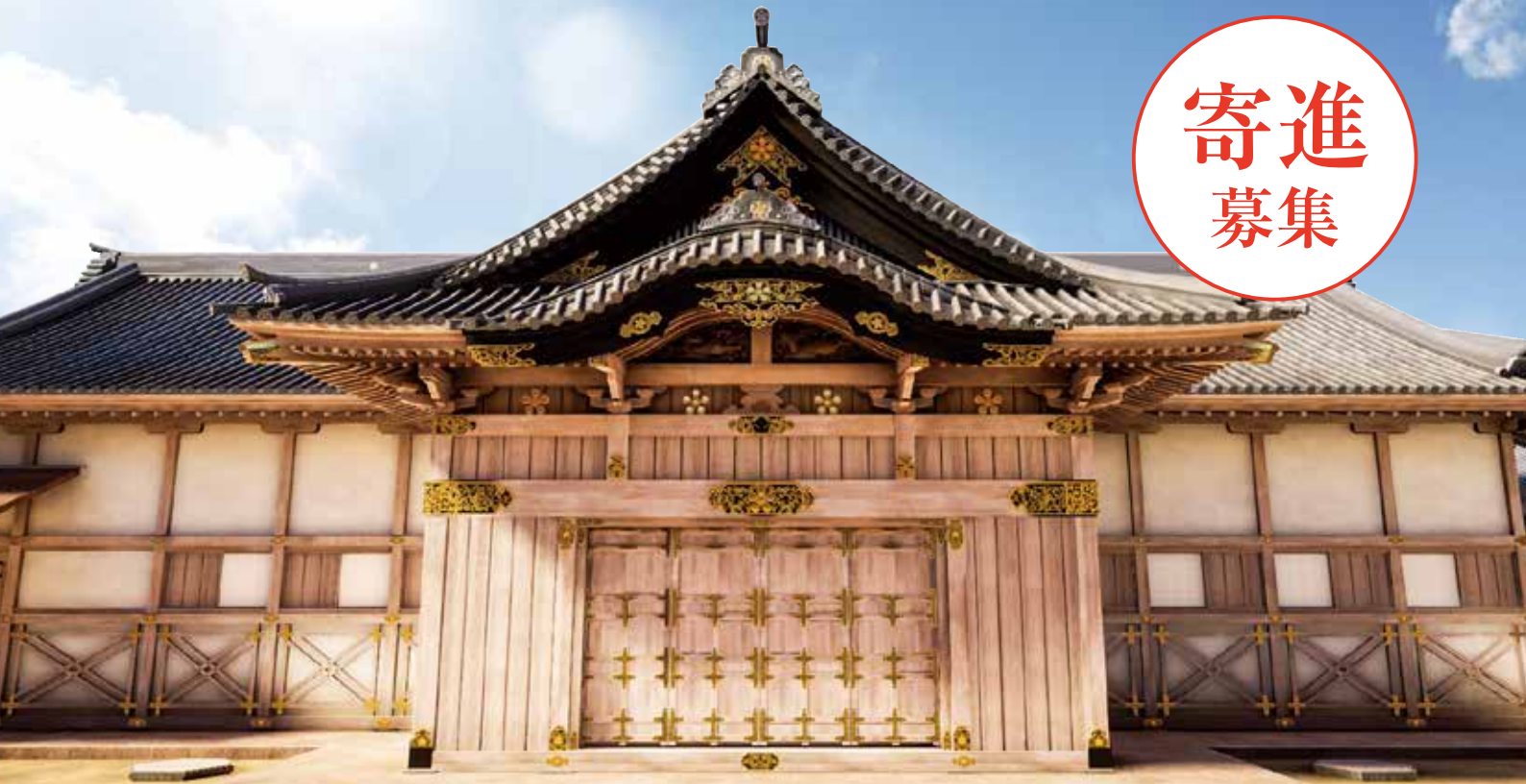
二の丸御殿復元イメージ

金沢城二の丸御殿は、二の丸の敷地全体に広がる城内最大の建物で、藩主の住まいや政務の場として城の中樞を担っていました。