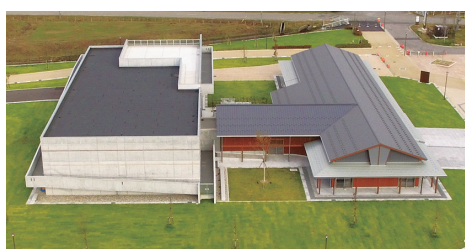
▲のと里山里海ミュージアム ▲能登歴史公園センター