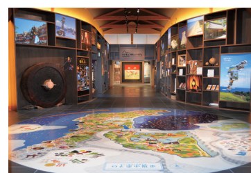
▲公園センター・エントランスホール (通路両側) 百景棚、(床) のと空中散歩