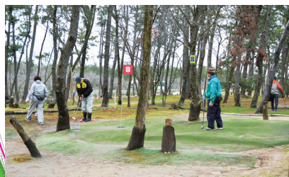
▲マレットゴルフ場