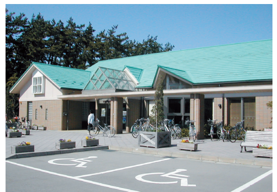
▲手取公園総合管理センター