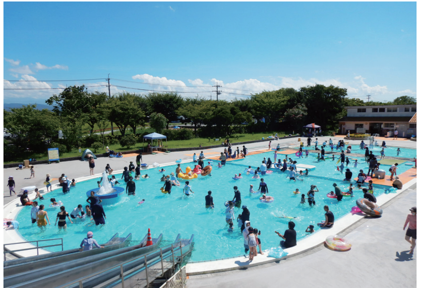
▲ウォーターガーデン

日本海と手取川と緑の中で憩える総合的なスポーツレジャーゾーンとして多くの県民に利用されています。