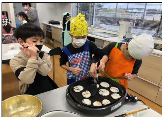
9月11日 石臼体験と おはぎ作り