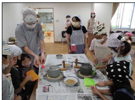
3月6日 春の和菓子 作り