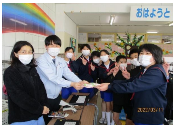
3月 お世話になった皆さんへ お礼の手紙を添えて宝達葛のプレゼント