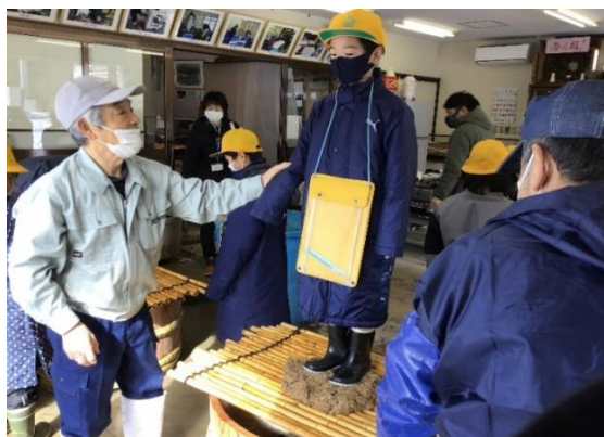
1月24日 宝達葛会館にて 宝達葛の昔ながらの作り方を体験