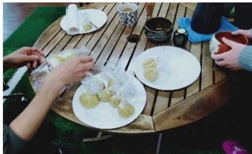
3月5日 講師より茶道についての講話と作法を学び、一人ひとり一連の流れを体験しました。 お茶菓子の芋巾着も皆で協力して作りました。