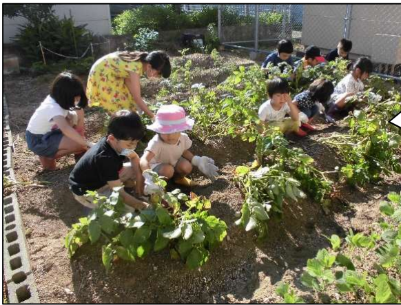
6月17日 ジャガイモ掘り