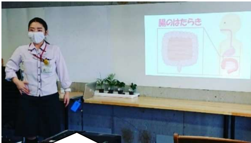
8月19日 ヤクルト北陸の食育講座「腸のはたらきと脳との関係」についてお話しいただきました。