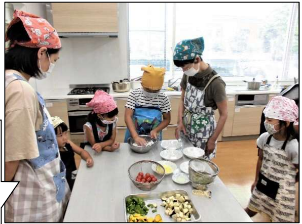
7月4日 ジャガイモお菓子作り