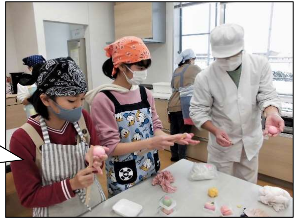
1月9日 新春和菓子作り

～代表者からのメッセージ～ コロナウイルスの感染拡大防止のため、4月・5月の活動ができませんでした。また、調理をして楽しく食べる場を持つこともできないため、作ったものを持ち帰るお菓子作りが中心になりました。 来年度以降も安全面を考慮して、子どもたちの豊かな体験が減ることのないように工夫して実施していきたいと思ひます。