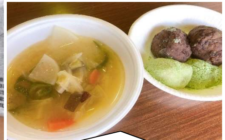
11月21日 畑で野菜を収穫し、めった汁とお餅を作って皆で楽しく食べました。後片付けも協力して行いました。