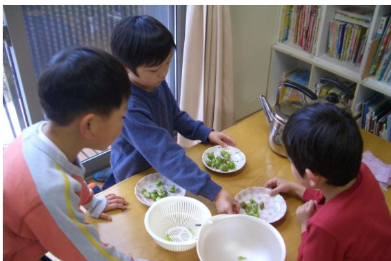
3月10日 ふきのとうをみんなで摘んできて、調理のお手伝いをしました。