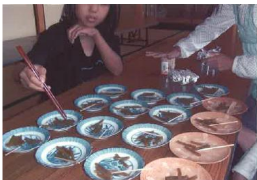
10月14日 さつまいものついで金平を作り、みんなに試食をしてもらいました