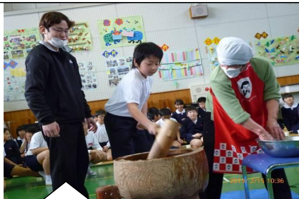
1月17日(木) 今浜苑でもちつきをしました。 つきたてのおもちは美味しかったです。