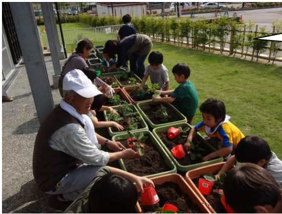
5月26日 おひさまくらぶの庭にて 夏野菜の苗をみんなで植えました