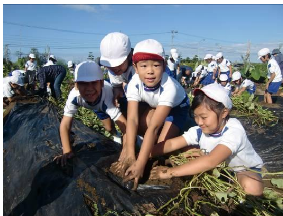
10月9日(火) さつまいもの収穫をしました。 大きないもがたくさん取れました。