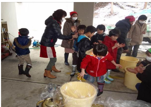
2月11日 児童館にて 寒の味噌作りの指導をしました