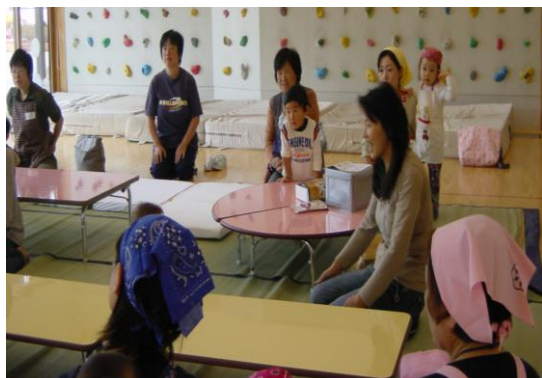
10月7日 もんぜん児童館にて 調理の前に最近楽しかった事を話しました