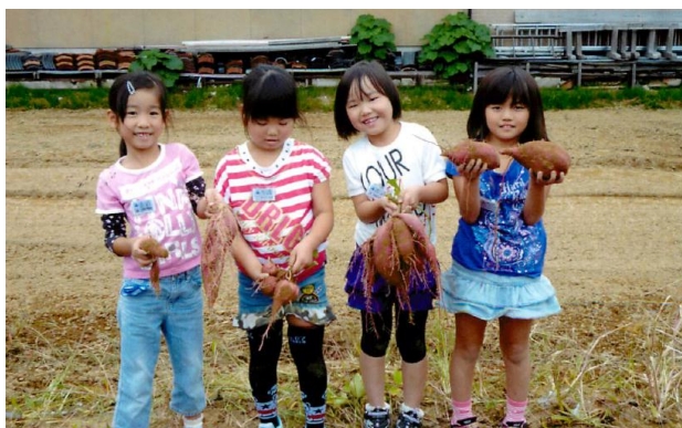
平成24年10月27日 第一コミュニティセンターの畑でサツマイモを収穫しました。