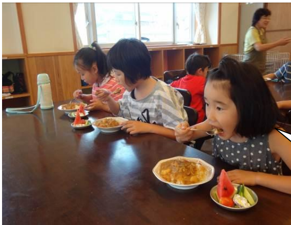
8月25日 おひさまくらぶの庭で立派に実った 野菜でカレーとサラダをつくりました。 「おいしい！」