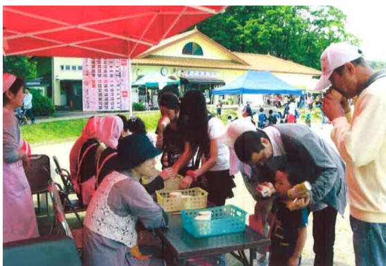
5月26日 フルーツ寒天をみんなに試食をして もらいました