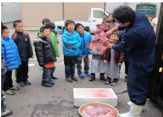
12月2日 輪島漁港にて あんこうの吊るし切りを披露しました

○あんこうの吊るし切り実演と魚介類の調理指導を支援 (平成24年12月2日(日) 応援者5人)