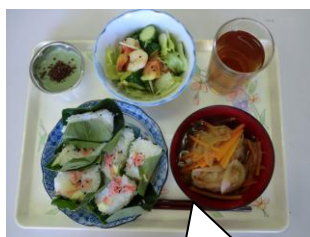
かしわそうめん、えびとトマトと胡瓜の冷やし甘酢和え、抹茶みるく茶巾も添えました。

8月5日 紙芝居（もったいない）をした後、親子で柿の葉寿司作り。子ども達は興味津々です。