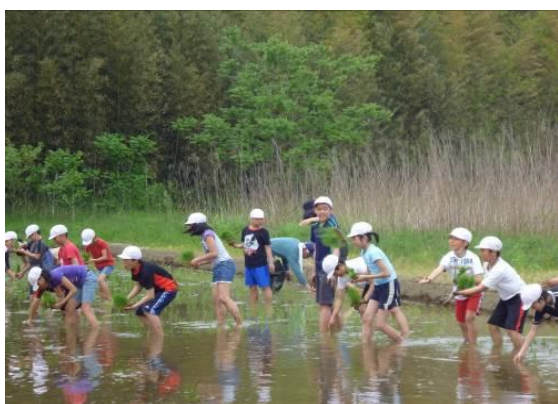
5月9日(水) 今浜苑の水田で田植えをしました。 泥んこになりました。