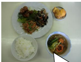
メニューは、きんぴらの明太子和え、しゅうごんのあんかけ、黒豆の「マ」がらめ、豚肉の八幡巻です。