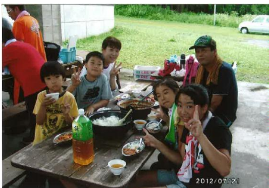
7月21日 子ども会合宿にて、子どもたちが作ったトマトを使ってのカレー作りをお手伝いしました