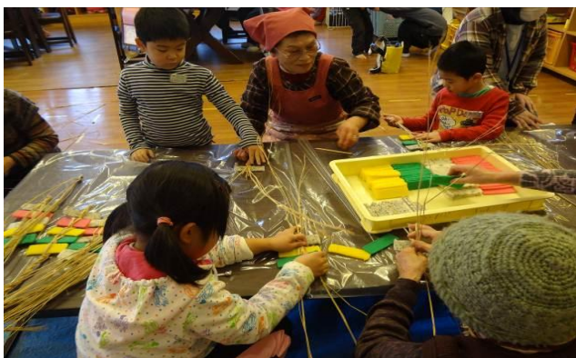
1月23日 穴水おひさまくらぶにて かきもち作りを指導しました