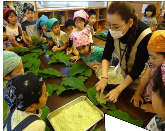
6月16日 きな粉ご飯をホウの木の葉っぱ で包んで作る、昔ながらのほうば飯づくりを体 験しました。