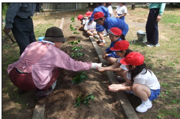
5月24日 河井小学校の畑にて さつまいもの苗植えをお手伝いしました