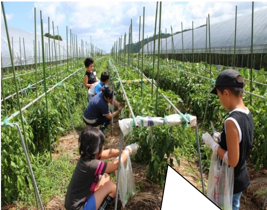
8月7日 上田農園にて野菜を収穫! その野菜を使ってオリジナル“じわもんピザ”を作りました。