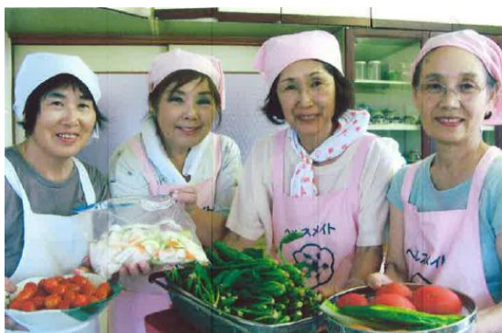
8月1日 自家製野菜で野菜たっぷり使った料理を作りました。