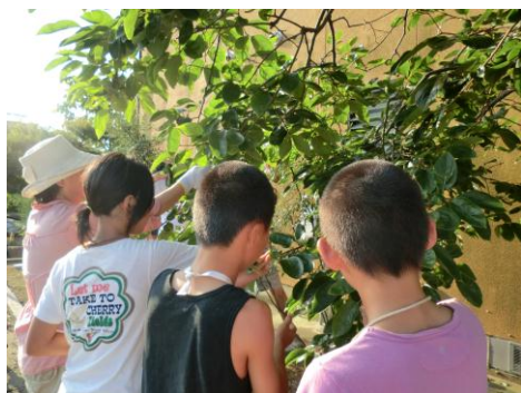
柿の葉寿司作りに向けて、みんなで柿の葉を採りました