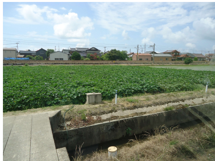
かぼちゃ栽培 ((農)島田地区営農組合)