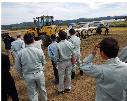
ホイールローダ試験圃場 (農林総研)