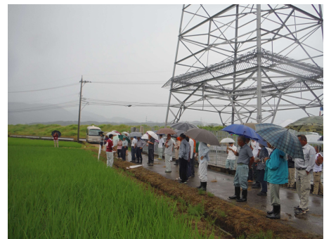
ひやくまん穀巡回(管内一円)