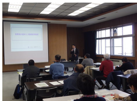
農業経営改善講座