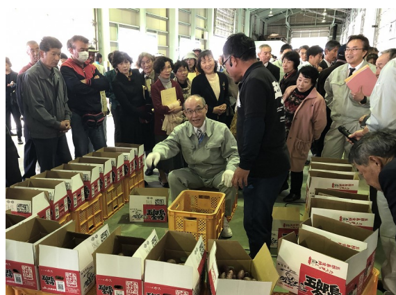
キュアリング施設 (JA 金沢市)