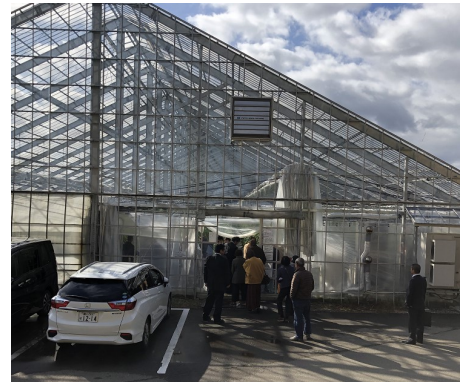
先進地視察(富山環境整備)