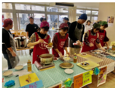
学園祭にて野菜カレーを販売 (加賀地区プロジェクト)