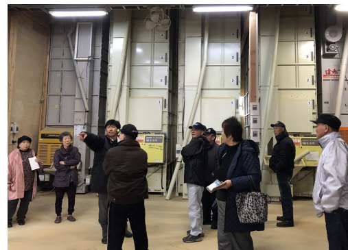
がんばる農家訪問(東田農産作業場)