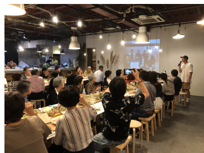
商工業者と連携した食談会の開催 (小松能美地区プロジェクト)