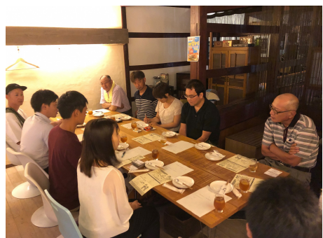
農業青年との意見交換(小松市内)