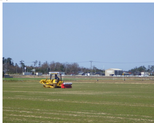
多機能ブルを活用した水稲直播 ( (農) 明峰ファーム)