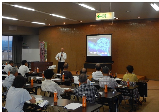
知ったらお得な研修会