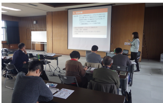
パソコン簿記講座