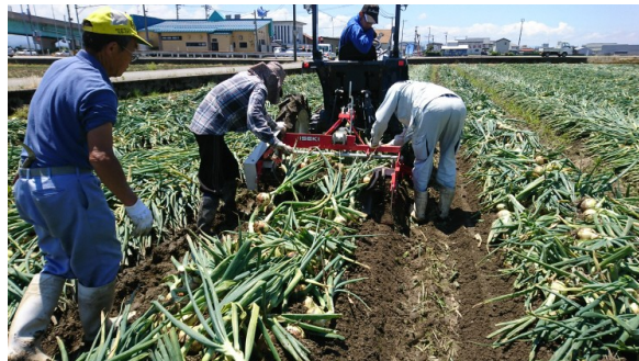
たまねぎの収穫 ( (農) 大長野水稲生産組合)