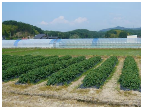
加工用トマトの栽培 (中海町集落営農組合)