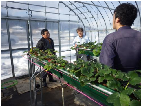
いちご栽培 ((農)アグリ松東)