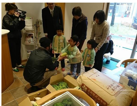
福祉施設への農産物提供 (加賀地区)