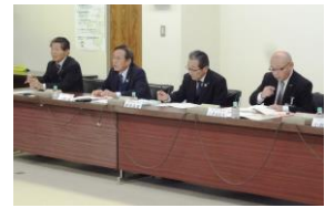
J A加賀役員及び加賀市との懇談会