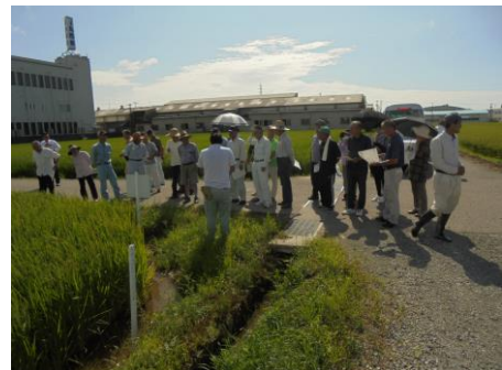
ひやくまん穀(移植圃場)