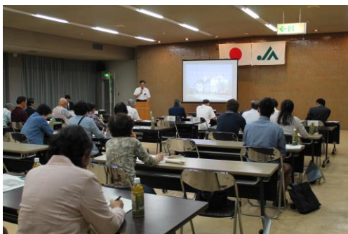
知ったらお得な研修会