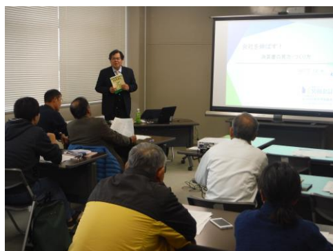
農業経営改善講座