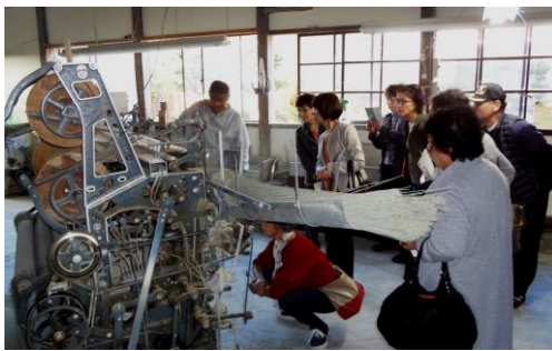
農家訪問(宮本農産)