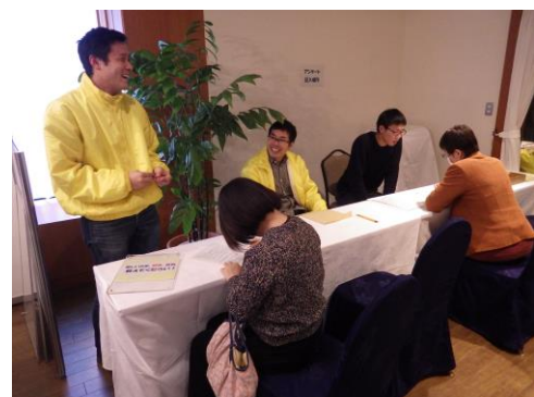
小松市主催商談会での 飲食店へのアンケート調査 (小松能美地区)