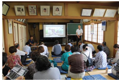
先進地視察((有)中山農産)