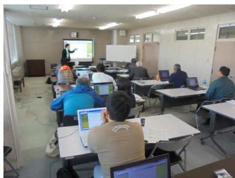
パソコン簿記講座