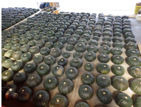
かぼちやの出荷調整 ((農)アイケーファーム)