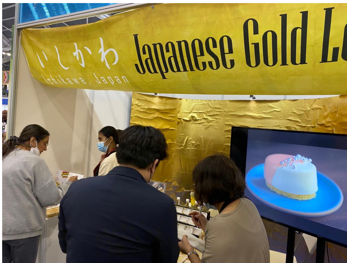
石川県金箔事業者様と横山商会現地法人 I-O&YT 様のブース

石川県からの出展としては、横山商会のシンガポール法人 I-O&YT と石川県の金箔事業者がブース出展し、石川県の伝統的工芸品である金箔（食用金箔）をレストランやホテル関係者に対して PR を行い、小職も集客・商品 PR など一緒に取り組ませていただきました。さらに、JETRO ブースでも石川県企業の商品が展示紹介しており、こちらでも商品 PR に取り組んだところです。また、ブースでの商品プロモーションに加え、ホール 1 にある特設ステージにおいてシンガポールの公立学校であるナンヤンポリテクと連携して石川県の日本酒のセミナーを開催しました。来場者したレストラン・ホテル関係者等に対し、説明を行いながら石川県の日本酒を実際に試飲いただいたほか、併せて石川県の工芸品を展示、紹介し、観光パンフレットの配付はもちろんのこと、石川県が運営する EC サイトで県産品が購入できる旨のアナウンスをしました。セミナー後、来場者から各々のお酒についての感想をいただいたほか、試飲した日本酒ボトルの写真や工芸品の写真を撮ってる方もたくさんいらっしゃいました。知識を深め、味覚を覚え、写真に収める、このような記憶と記録に残る体験を通じて石川県の日本酒や工芸品を世界の方に広く伝えて参りたいと考えています。