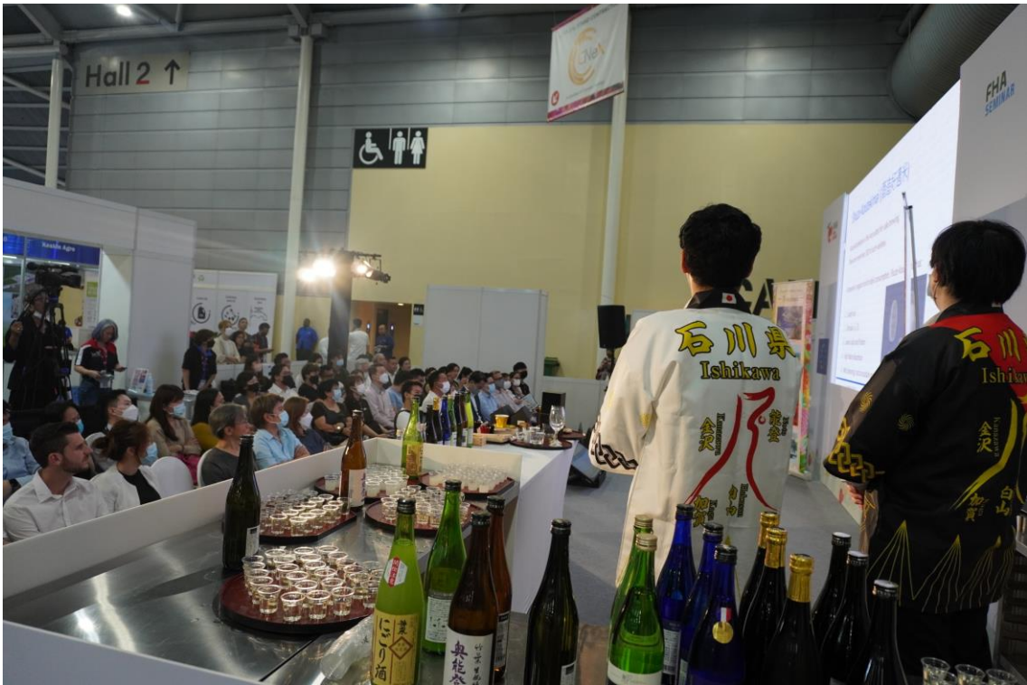
ナンヤンポリテクニクの講師とステージイベントの様子