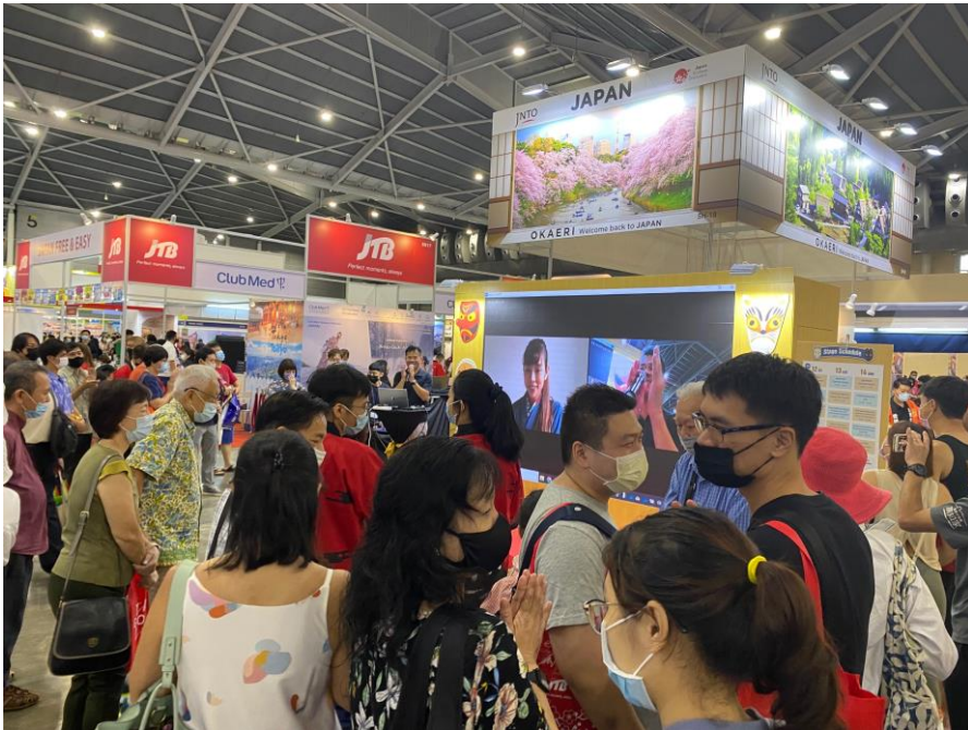
賑わう会場の様子