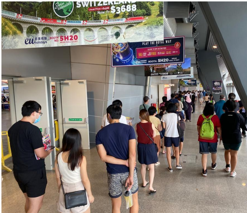
入場を待つ長蛇の列