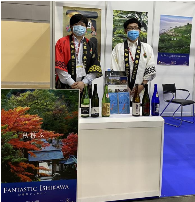
石川県 PR ブースの様子