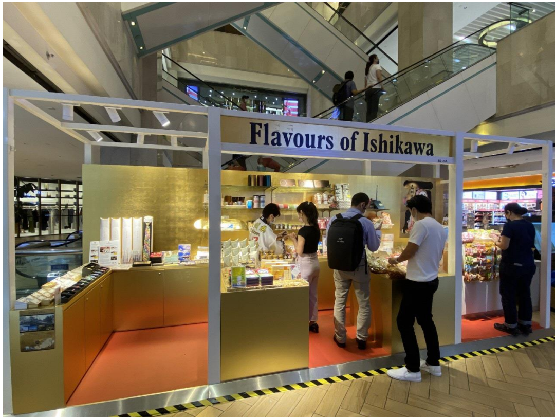
シンガポール高島屋に設置されたアンテナショップ