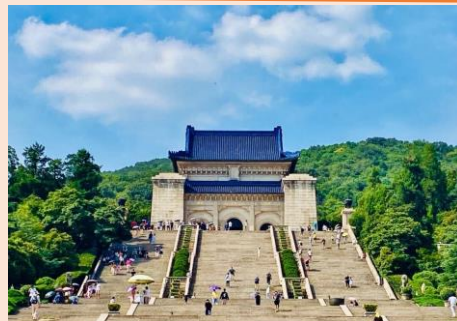
中華民国を建国した孫文の墓である中山陵

江蘇省は、上海のすぐそばにあり、三国志に出てくる呉や明、中華民国などの都が置かれた場所です。近代的な大都市の中に多くの史跡が残り、現代の中国と悠久の歴史を一度に感じる事が出来る場所です。