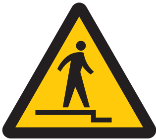
下り段差注意 Caution, uneven access / down 내리막 계단주의 小心下台阶 當心下樓台階