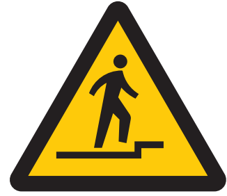
上り段差注意 Caution, uneven access / up 오르막 계단주의 小心上台阶 當心上樓台階