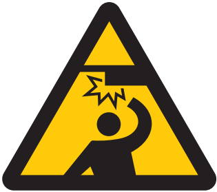
天井に注意 Caution, overhead 천장 주의 小心碰头 當心頭部