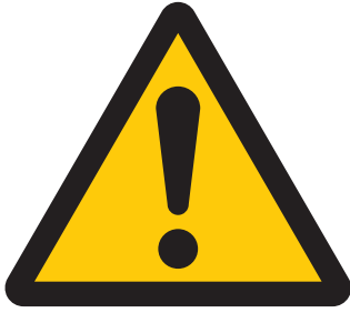
一般注意 General caution 일반주의 注意安全 警告