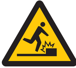
障害物注意 Caution, obstacles 장애물주의 小心障碍物 當心障礙物