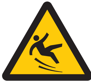
滑面注意 Caution, slippery surface 경사면 주의 小心路滑 當心地滑