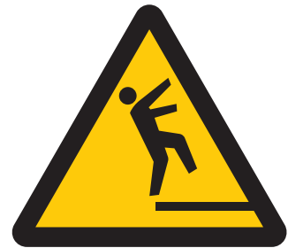
転落注意 ※1 Caution, drop 전락 주의 小心摔跤 當心跌倒