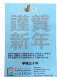
副業をしている社員が強みを活かし、ポスターや年賀状のデザインを担当