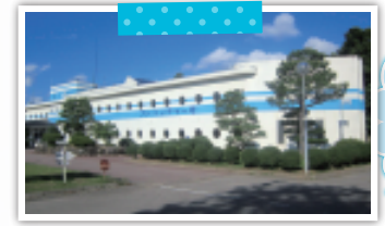
石川県立能登少年自然の家