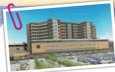
新 石川県立中央病院 完成予想図