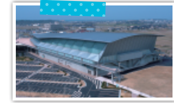
いしかわ総合スポーツセンター