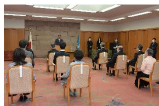
いしかわ婚活応援優秀企業知事表彰式