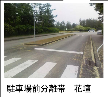
駐車場前分離帯 花壇