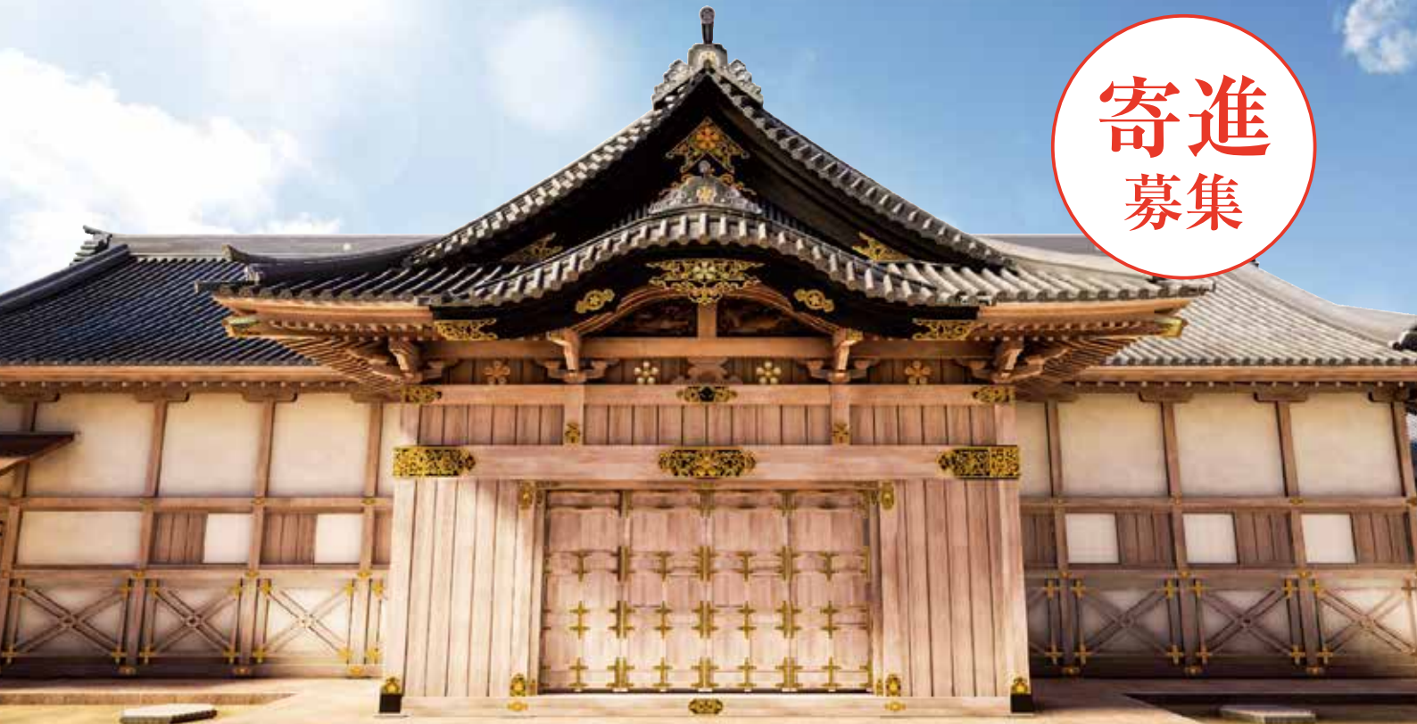
二の丸御殿復元イメージ

金沢城二の丸御殿は、二の丸の敷地全体に広がる城内最大の建物で、藩主の住まいや政務の場として城の中樞を担っていました。