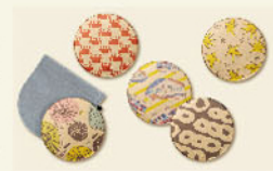
(株)第一 ラウンドミラー

「百万石フォント」は、障害のある人と地元デザイナーが作った石川県オリジナルの文字や絵柄です。制作の背景やストーリー、企業とのコラボレーションを紹介します。協力:地域支援センター ポレポレ