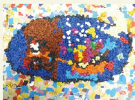
「クリスマス2025」 蛭可 聡