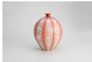
※第26回日本伝統工芸士会作品展 入賞作品