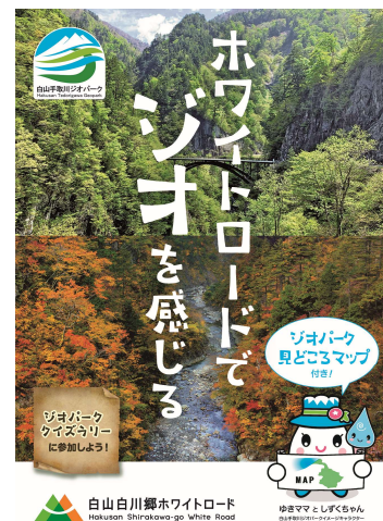
パンフレット表紙