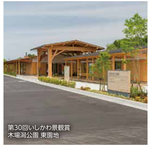
第30回いしかわ景観賞 木場潟公園 東園地