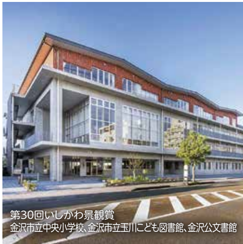
第30回いしかわ景観賞 金沢市立中央小学校、金沢市立玉川こども図書館、金沢公文書館