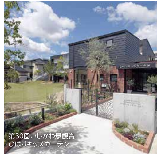
第30回いしかわ景観賞 ひばりキッズガーデン