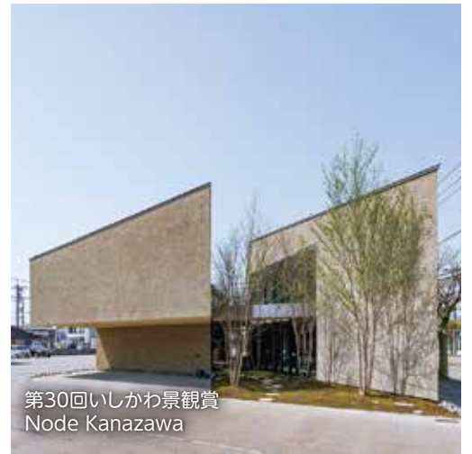
第30回いしかわ景観賞 Node Kanazawa