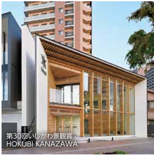
第30回いしかわ景観賞 HOKUBI KANAZAWA