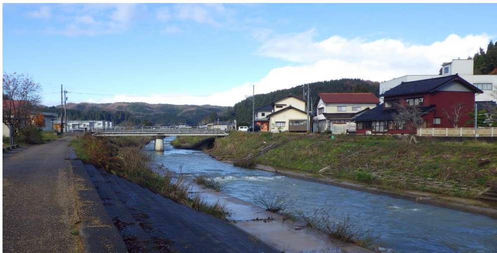
放流場所（柳田小より徒歩 10 分）