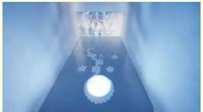
Keiken(Morphogenic Angels: Chapter 1) インスタレーション・デザイン© Keiken

DXP展は、アーティスト、建築家、科学者、プログラマーなどが集い、領域横断的に考えるチュートリアルな場です。