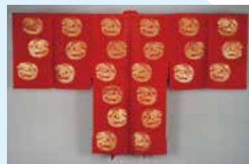
紅地雲菱に龍丸文舞衣 明治時代