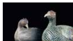
国宝「色絵雉香炉」(右)、重要文化財「色絵雉香炉」(左)