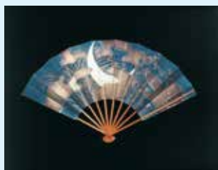
扇(銀五雲に月と秋草模様)