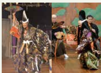
【左】 【右】