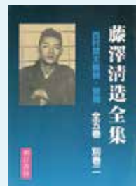
『藤澤清造全集』内容見本

お問い合わせ：☎076-262-5464(石川近代文学館(石川四高記念文化交流館))