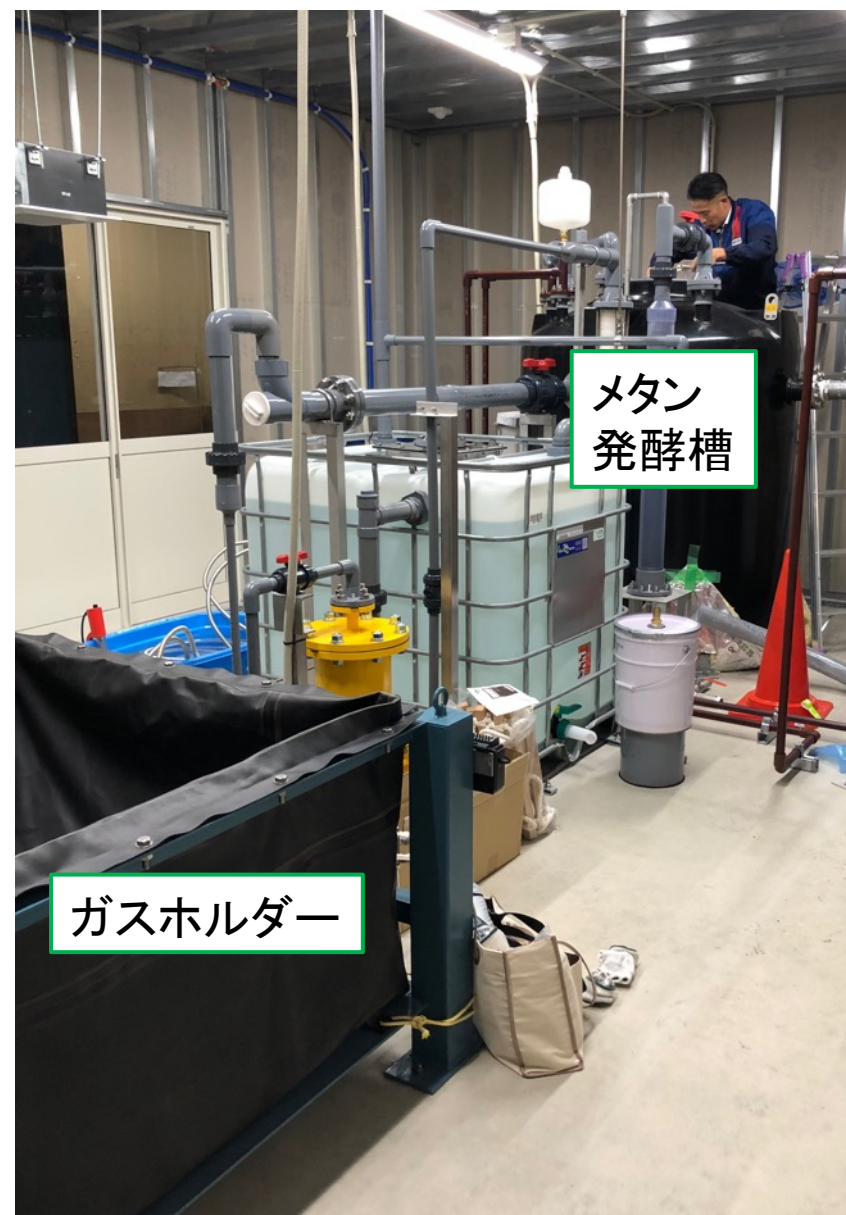
写真:PLANT3川北店に設置された発酵装置