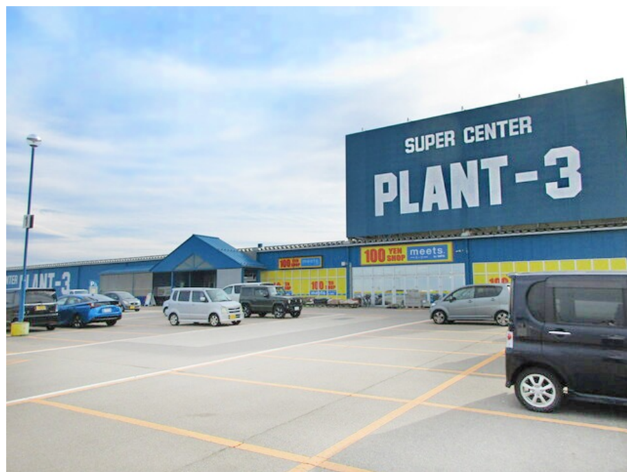
写真:実証先のPLANT3川北店