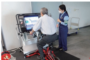
サイクルシミュレーター