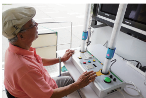
クイックキャッチ

自転車に乗る上での様々な安全運転体験ができるシミュレーターをご用意しました。この機会に、ぜひご体験ください。