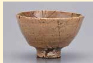
重要文化財「大井戸茶碗 銘 筒井筒」 (李朝15~16世紀)