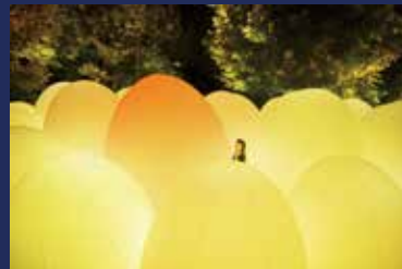
(自立しつとも呼応する生命の森) ©チームラボ