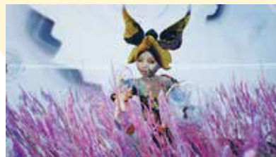
Keiken (Morphogenic Angels and The Bubble Theory) 2022

デジタルテクノロジーと人間の関係から生まれる 新たな可能性とそれを変容させるアート之力。 その先にあるデジタルと私たちの生活の未来を考える。