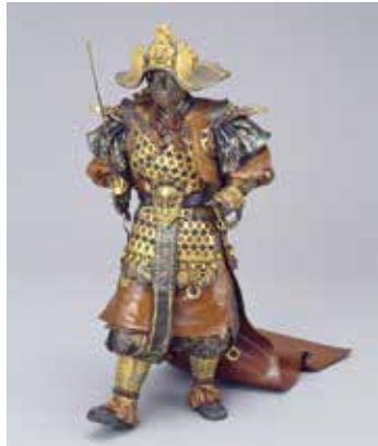
《太平楽置物》海野勝珉 1899年 / 国立工芸館で通期展示