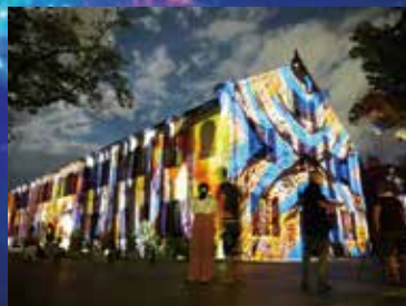
D-Kapplication by FORUM8