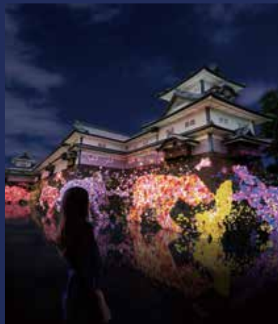
《金沢城の石垣に住まう花と共に生きる動物たち》 ©チームラボ※参考画像

8日間限定で、「皇居三の丸尚蔵館収蔵品展」「御殿の美」展の開館時間を20時まで延長します。(入館は19時半まで) 会場：県立美術館 国立工芸館 県立歴史博物館