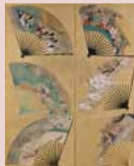
《扇面散屏風》依屋宗達(左隻)部分 17世紀 皇居三の丸尚蔵館収蔵

県立美術館で通期展示される《扇面散屏風》(依屋宗達筆)を参考に、扇形の画用紙に絵を描いて、参加者全員でひとつの扇面散屏風を作ります。 定員: 各日10組程度(先着順) 申込方法: 兼六園周辺文化の森HP 会場: 県立美術館