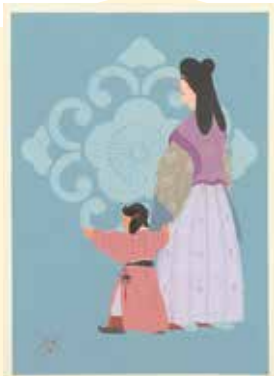
西のぼる画 ポスター・チラシ原画