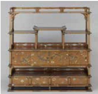
《鳳凰菊文様時給飾棚》島田佳矣ほか 1928年 / 国立工芸館で通期展示

第1会場: 県立美術館 ☎076-231-7580 第2会場: 国立工芸館 ☎050-5541-8600 (ハローダイヤル) 観覧料: 2館共通券 一般1,500(1,200)円、大学生1,000(800)円、高校生以下無料 ( )は前売料金・20名以上の団体料金・割引料金