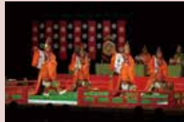
舞楽「萬歳楽」

料金: 1,500円、高校生以下無料 定員: 400名 チケット取扱: 県立能楽堂、 県立音楽堂チケットボックス、 香林坊大和プレイガイド 会場: 県立能楽堂