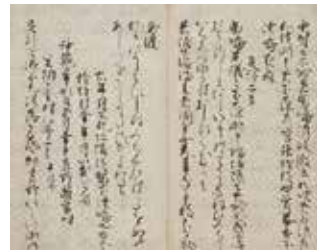
国宝《金沢本万葉集》巻第六 藤原定信 12世紀 前田育徳会所蔵 / 県立美術館で前期展示

県立美術館VRシアターに 国宝《金沢本万葉集》の映像作品登場! 10月13日～毎日上映