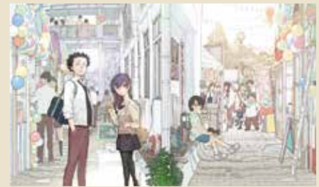
「聲の形」原画展イメージ

お問い合わせ: いしかわ百万石文化祭2023実行委員会事務局 ☎076-225-1354