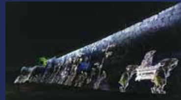
(Walk, Walk, Walk - 金沢城)