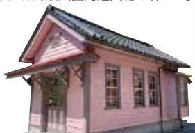
レトロミュージアムショップ