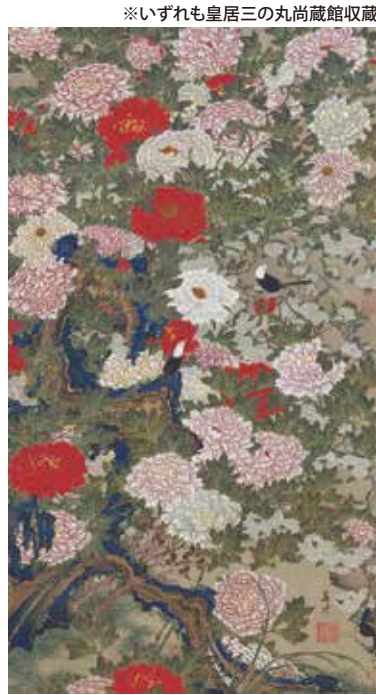
※いずれも皇居三の丸尚蔵館収蔵