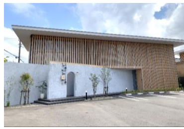
ハレノテモリ【小松市】 設計: 小笠原弘建築計画 施工: 株式会社 シモア