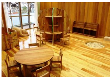
能美市辰口中央児童館【能美市】 設計: 株式会社 コスモ計画設計 施工: 松浦建設・辰建特定建設工事 共同企業体