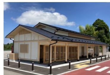
七尾城登山口駐車場休憩案内所【七尾市】 設計: 武岡設計事務所 施工: 株式会社 シラヤマ