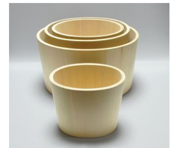
あすなろの楕円桶 (製造者: 輪島キリモト)