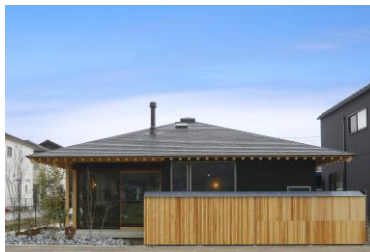
杵の家 どんぐりのいえ【白山市】 設計・施工: 株式会社 済田工務店