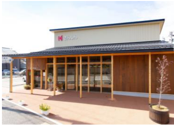
金沢信用金庫大聖寺支店【加賀市】 設計: 株式会社 高屋設計環境デザインルーム 施工: 小中出建設 株式会社