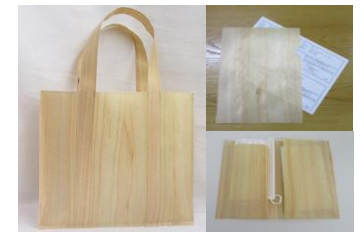
森シリーズ: バッグ、ファイルケース、 マスクケース(製造者: 株式会社谷口)