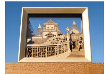
のとひばこ 雅 (製造者: 東森木材 株式会社)