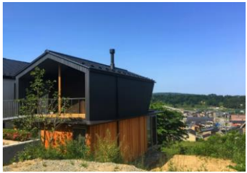
田上新町見晴らしの家【金沢市】 設計: 谷重義行建築像景 施工: 有限会社 けやき住建+ライフデザイン