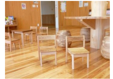
KIDSチェア (製造者: 株式会社 町八家具)