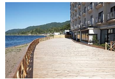
ホテルこうしゅうえん天海シーサイドテラス 【輪島市】 設計・施工: 山下住宅