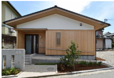
土蔵の面影を残す木の香の家【金沢市】 設計: 有限会社 風建築設計工房 施工: 株式会社 棚田建設