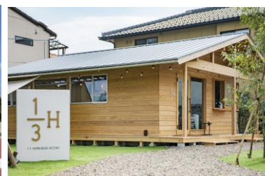
1/3ハンバーガーファクトリー【金沢市】 設計: 株式会社ボスコ、百一 施工: アイズ建築