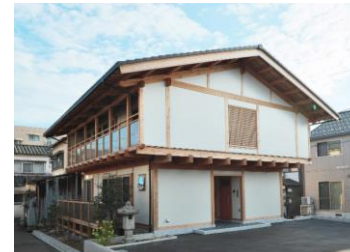
二世帯の大屋根の家【金沢市】 設計: 有限会社 金沢設計 施工: 若狭建設株式会社