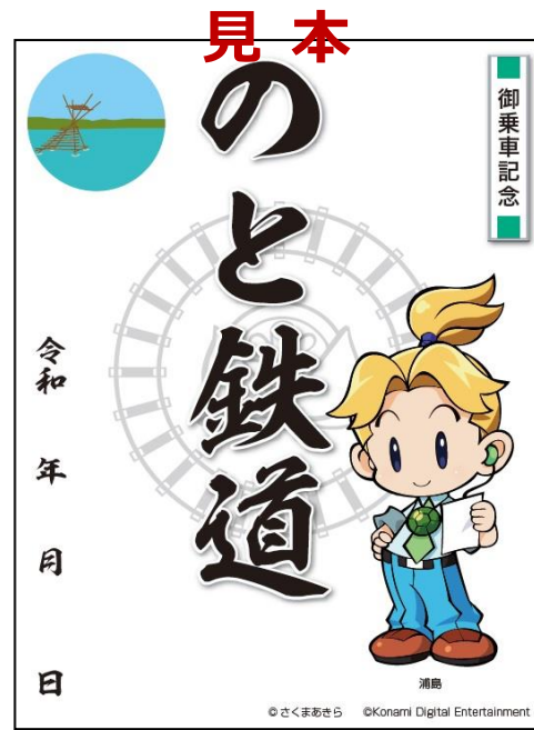
【桃太郎電鉄コラボ鉄印】300円

※【のと鉄道応援鉄印】【桃太郎電鉄コラボ鉄印】ともに、マイスターカード取得対象鉄印となります。 ※上記鉄印は一時的に売り切れになる場合もあります。