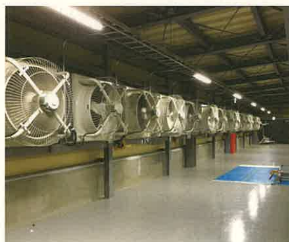
【吸気用有圧換気扇 (16基設置)】