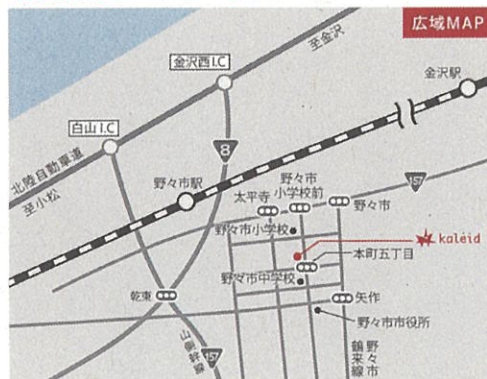
会場マップ:ののいちカレード

◆会場に駐車場はございますが、台数に限りがありますので乗り合わせてお越しください。