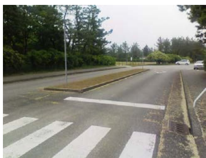
駐車場前分離帯 花壇