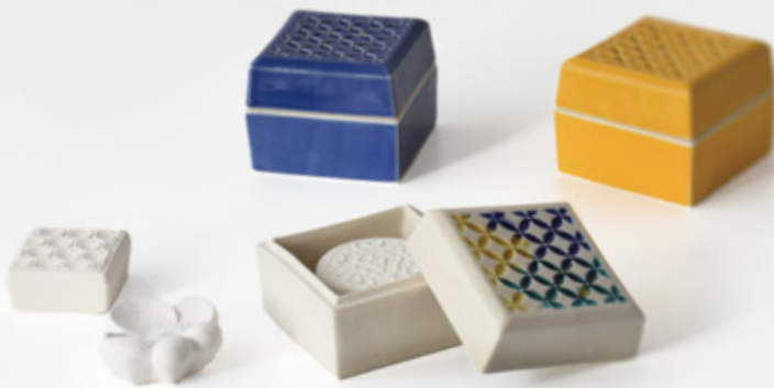
高木 雅美・山海 愛 [(有) ミランティジャパン]