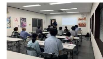
市場や水産物に関するお話