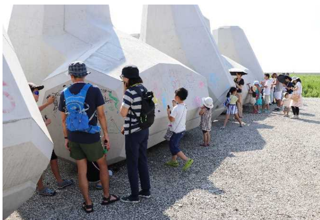
消波ブロックでお絵かき体験