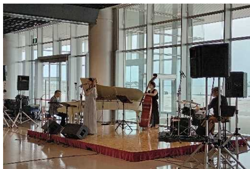
日本海を背景に毎回違う演奏家が出演

ピアノ、バイオリンなどの楽器演奏やコーラスなどのコンサートが開催されているほか、物産展など多種、多様なイベントが開催され、各地から大勢の方が訪れます。