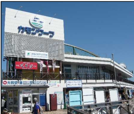
構成施設のイメージ