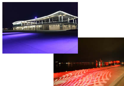
金沢港ライトアップ(毎日)