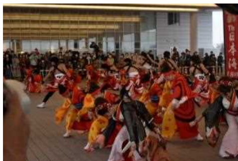
2F展望デッキでYOSAKOIソーランによるクルーズ船のお見送り。