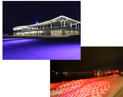
金沢港ライトアップ(毎日)