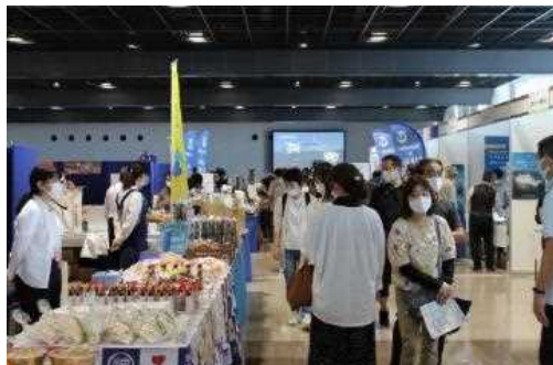
全国各地からのアンテナショップ等が集まり、特産品を販売。