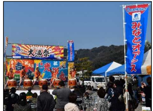
地域振興イベントの開催状況