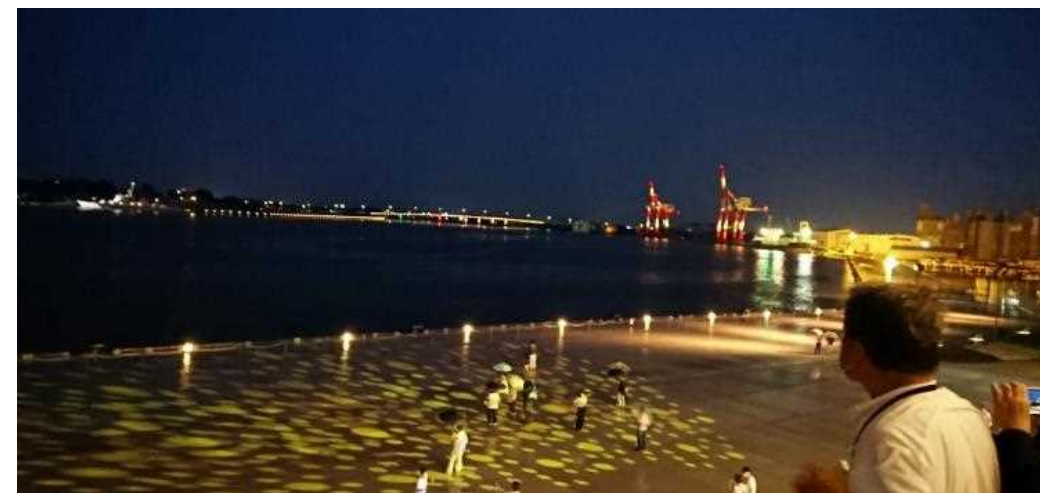
ライトは加賀五彩をイメージした「臙脂、藍、黄土、草、古代紫」の5色が5分間隔で切り替わり、港全体でおもてなし空間を創出しています。