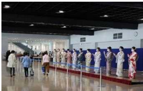
1F CIQエリアでの加賀友禅大使によるお出迎え

クルーズ船寄港時の歓送迎式では加賀友禅大使によるお出迎えやYOSAKOIソーランによるお見送りを披露するなど、様々なイベントでクルーズ旅客だけでなく、クルーズ船を見送りに集まった地元住民も楽しめるイベントです。