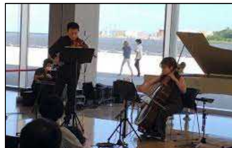
バイサイドコンサート