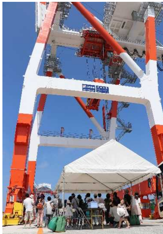
コンテナの荷役をおこなう ガントリークレーンを間近で見学