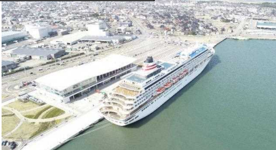
クルーズターミナル全景

金沢港クルーズターミナル完成後、初のクルーズ船「飛鳥Ⅱ」寄港時には約1万人の観客が来場（令和3年4月2日）