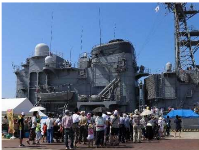
海上自衛隊の護衛艦の艦内見学

毎年7月に開催される金沢港を代表するイベントであり、港周辺施設を巡る見学バスツアーや海上自衛隊護衛艦の艦内見学や海上保安庁巡視艇の体験航海など、大人から子供まで楽しめる人気なイベントです。