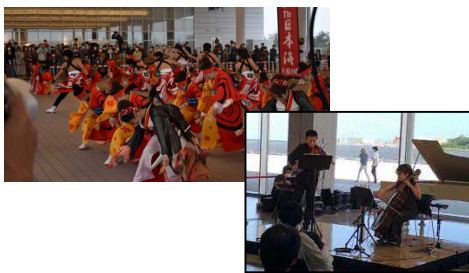
クルーズ旅客歓迎イベント(クルーズ船寄港時)及びベイサイドコンサート(週末)

(注):税関(Customs)、出入国管理(Immigration)、検疫所(Quarantine)の略で、人や貨物の国際的な移動の際に必要な手続き・施設のことを指す。