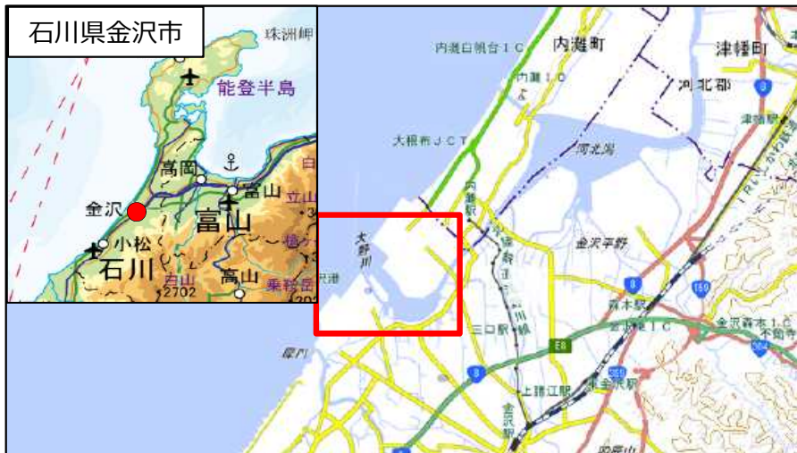
国土地理院地図（電子国土Web）(https://maps.gsi.go.jp)をもとに石川県作成