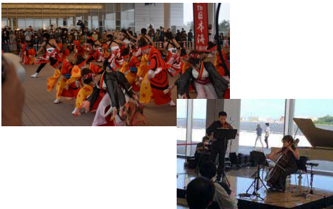
クルーズ旅客歓迎イベント(クルーズ船寄港時)及びバイサイドコンサート