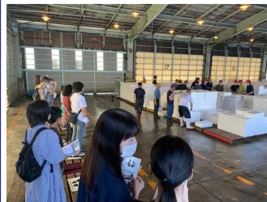
スルメイカのセリ見学

かなざわ総合市場では、活気あるセリや鮮度を保つ氷点下の世界など、非日常の世界を間近で体験できます。 ※開催時期、見学内容は以下のHPより要確認。