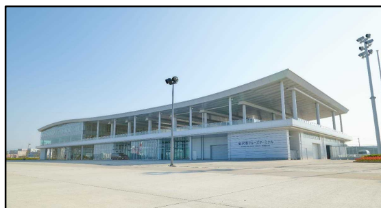
金沢港クルーズターミナル