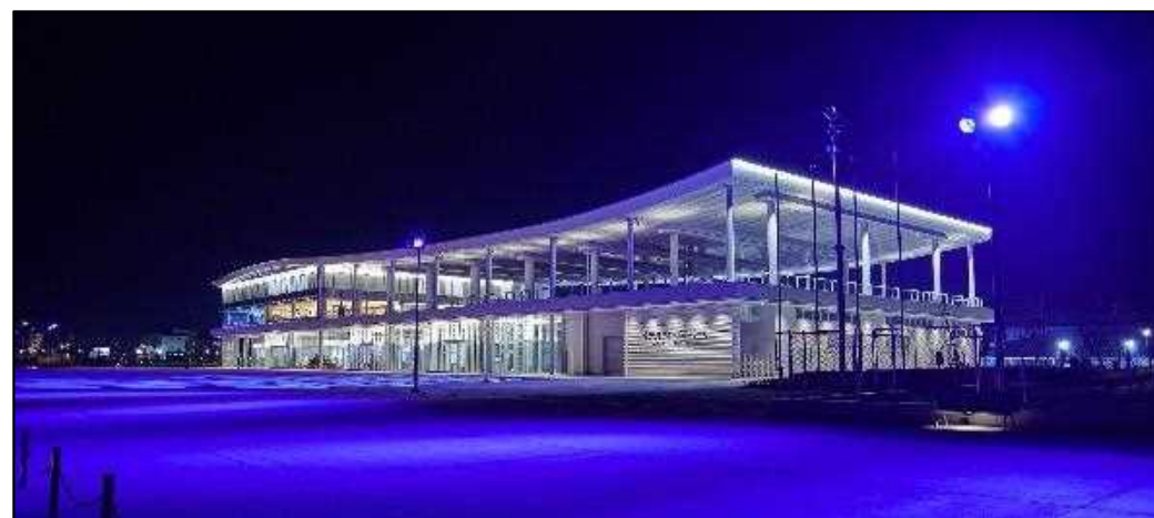
日本海の白波をイメージした屋根がライトアップにより一層、波の形が際立ちます。

金沢港クルーズターミナルやガントリークレーンなど金沢港内を取り囲むように約3キロにわたりライトアップが行われています。毎日、日没から9時まで点灯。