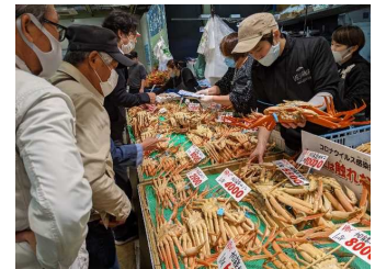
カニカニまつり(11月)