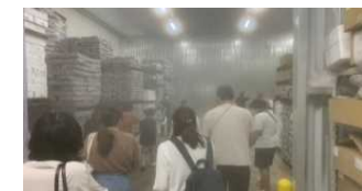
冷凍施設で-30℃の世界を体験

【県漁協HP： http://www.ikgyoren.jf-net.ne.jp/tour/ 】