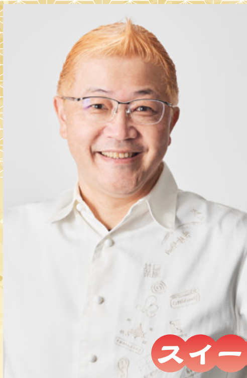
講師▼辻口博啓氏(パティシエ)